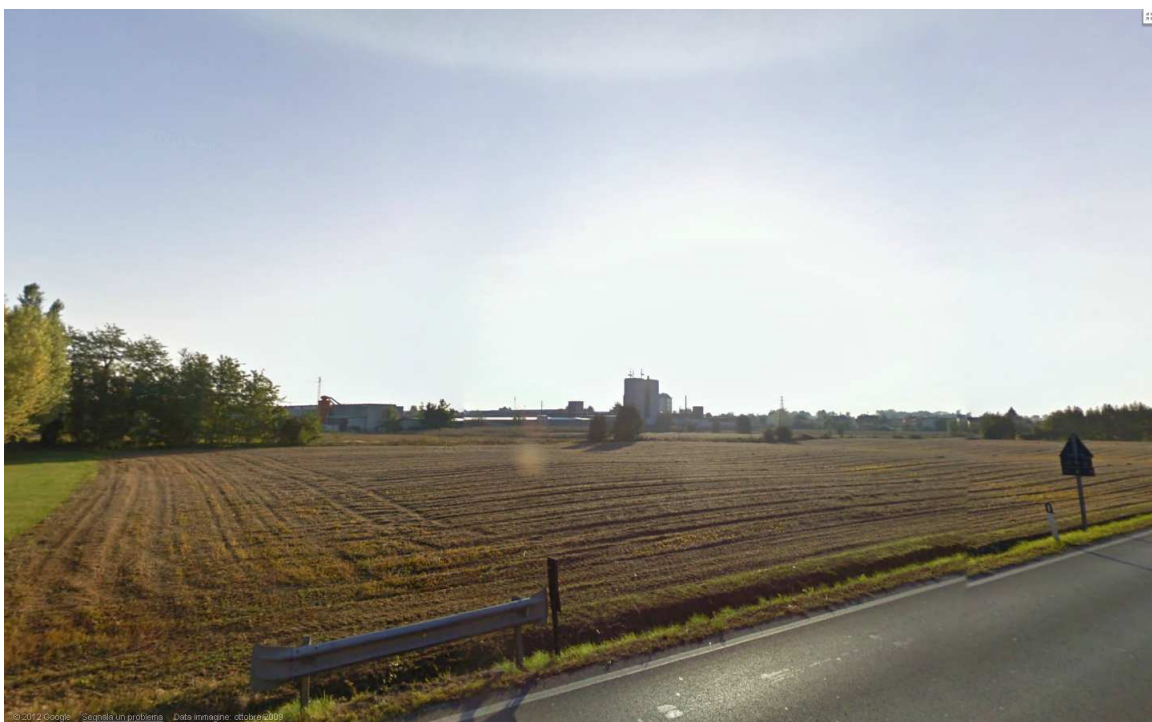
Immagine dell'area in cui dovrebbe sorgere il Parco Tecnologico, vista dalla SP346