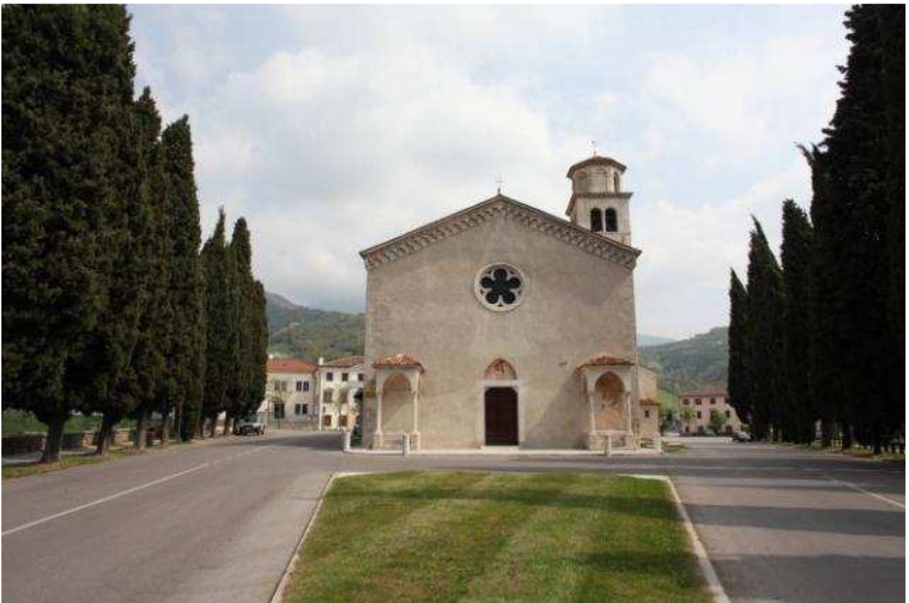
Figura 7: La Chiesa millenaria della Pieve di Bigonzo

Lungo via Calcada si trova il palazzo rinascimentale della famiglia Piazzoni; finita la via la strada continua come via S.Andrea: su entrambe le vie si possono incontrare altri esempi di case storiche. Arrivati in piazza Pieve, con a destra la chiesa millenaria, proseguendo per altri 200metri lungo la strada, che in questo tratto prende il nome di via Carso, si può trovare sulla sinistra la Chiesa di S.Giuseppe in Campo, a fianco dell'attuale cimitero, le cui origini risalgono al 1200.