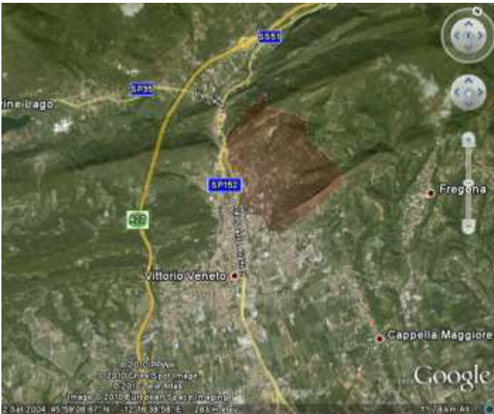
Figura 1a: la Città di Vittorio Veneto, con evidenziata l’area della Conca di Bigonzo

E’ attraversata da diversi corsi d’acqua fra i quali i principali sono il Rio dei Casai e il Rio Rindola nel quale il primo confluisce all’altezza del Cimitero di S.Andrea.