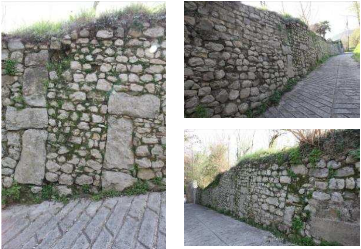
Figura 9: resti del portale di S.Pietro nel Borgo di Vinera

Oltre a questi importanti esempi di edifici storici troviamo in località Vinera i resti del portale di S.Pietro con una sua storia documentata già nel 1277 (Figura 9).