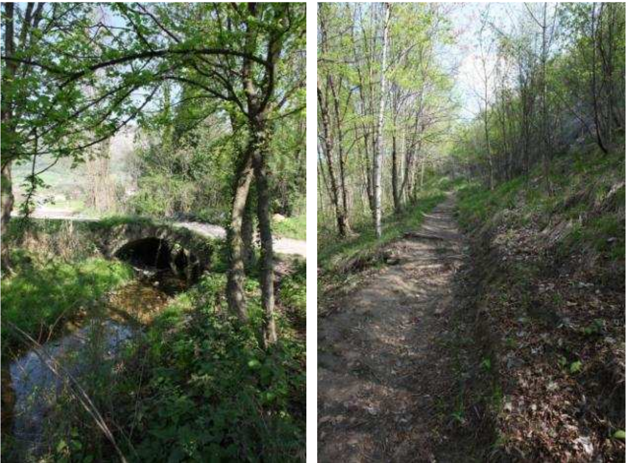
Figura 3: a sinistra un ponticello sul torrente Rindola, con sullo sfondo la collina di Piadera; a destra sentiero sulla Costa di Fregona dove si può notare la presenza diffusa di specie alberate quali betulle e carpini.

Le immagini seguenti illustrano alcuni esempi dell'ambiente naturale della zona (Figura 3, Figura 4)