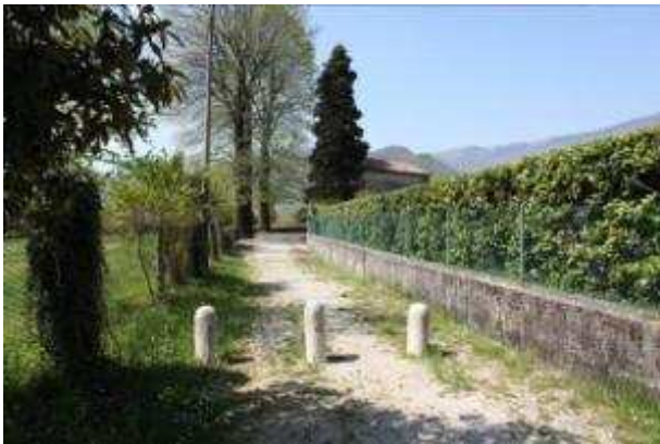
Figura 10: Madonna della Tosse nel Borgo di Rindola

Per quanto riguarda la storia delle origini del centro storico e dei suoi dintorni, i primi documenti risalgono a dopo la metà del XII sec., e di certo si sa che il borgo si sviluppò attorno al castello caminese sul Meschio.