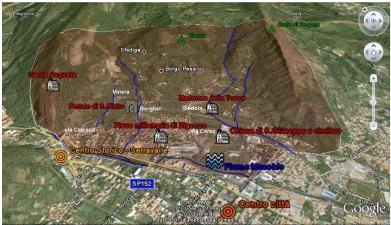
Figura 1b: la zona della Conca di Bigonzo con evidenziati gli edifici storici più importanti